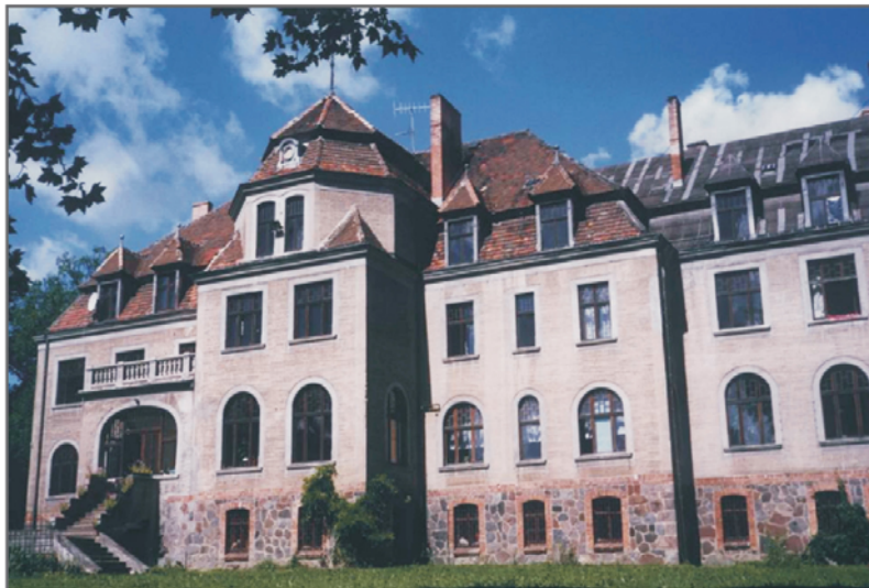
B. Dwór w Pieńkowie.