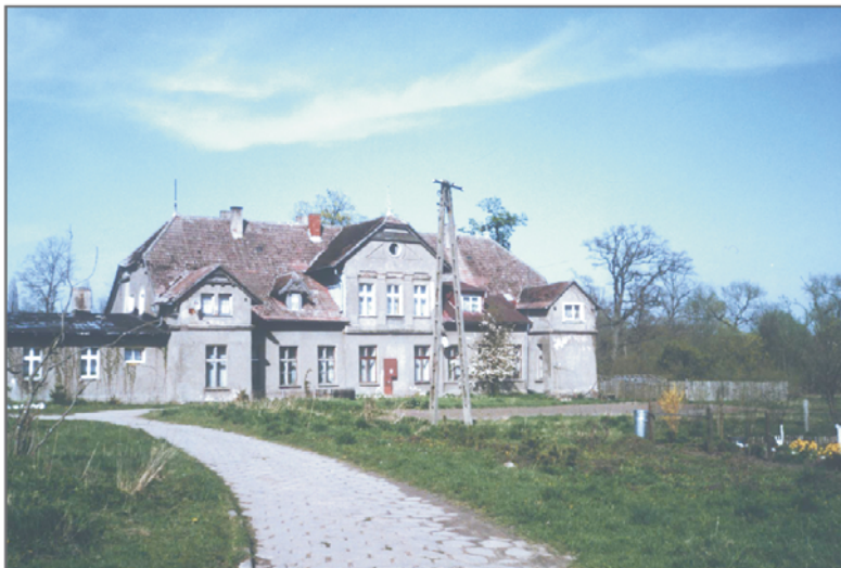
A. Dwór w Pieszczu.