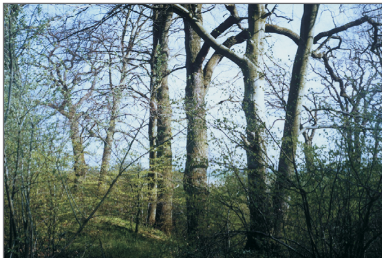
B. Park w Wykrotach.