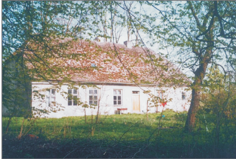
A. Dwór w Pałowie.