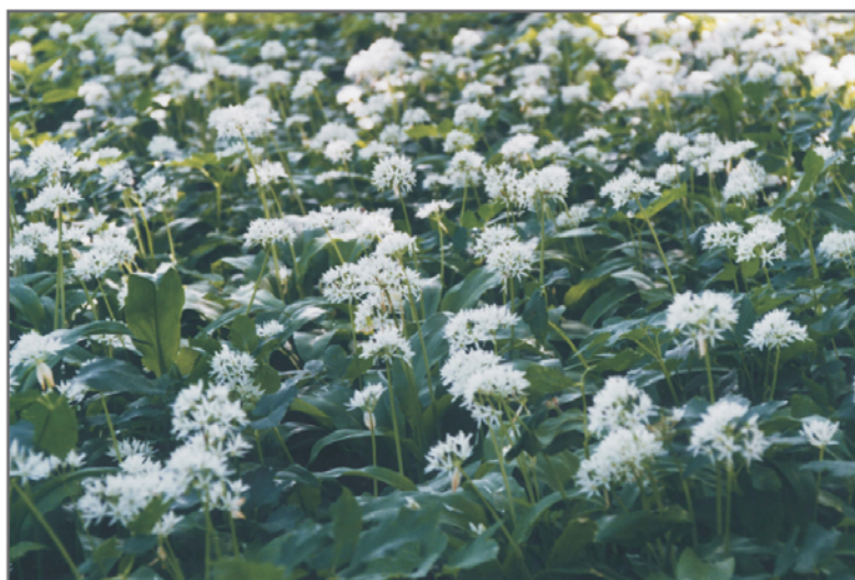
B. Czosnek niedźwiedzi Allium ursinum w parku w Wykrotach.