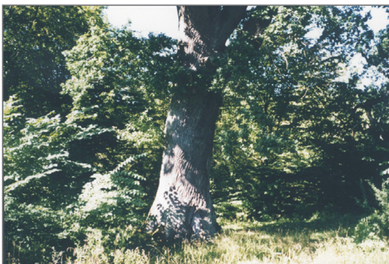
B. Dąb szypułkowy Quercus robur o obwodzie 590 cm w parku w Pieszczu.