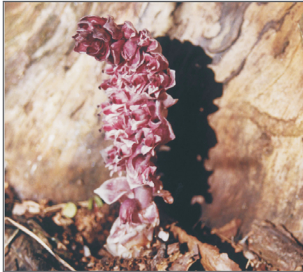
A. Łuskiewnik różowy Lathraea squamaria w parku w Pieńkowie.